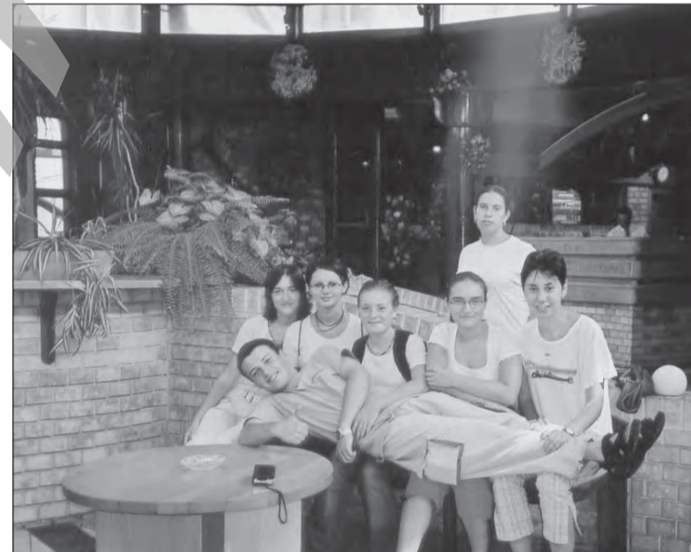
Budapesta - în holul Hotelului Hunor