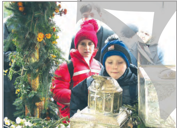
LA ZI PAG. 3