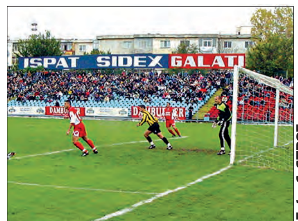
SPORT PAG. 11