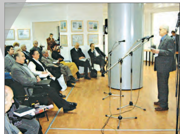
LAZI PAG. 3