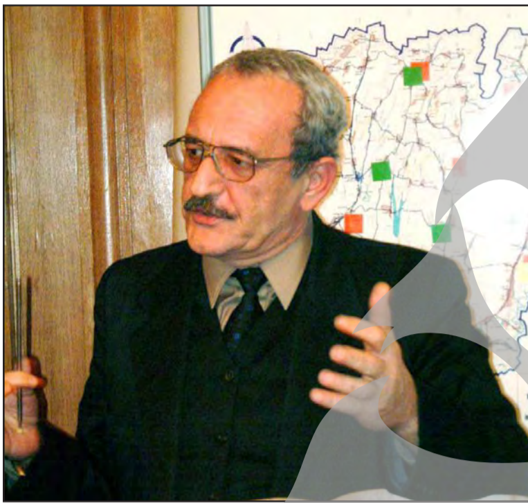
și grantul obținut.

- În cadrul Programului PHARE Ricop, Componenta "Lucrări Publice", în urma câștigării de către județul Galați a 20 de proiecte având un buget de 3 milioane de euro, în Galați au intrat peste 2,6 milioane din fonduri europene. Cu acești bani, în multe localități din județ se construiesc, se reabilitază și se extind sistemele de alimentare cu apă, se repară școli, se refac poduri sau se ridică unele noi. Am accesat și Programul SAPARD, "Dezvoltarea și îmbunătățirea infrastructurii rurale", în cadrul căruia Galațiul a obținut finanțare pentru 23 de proiecte (11 alimentări cu apă și 12 reabilitări de drumuri). Bugetul total al proiectelor care au obținut finanțare depășește 15,5 milioane de euro, cam la același nivel ridicându-se