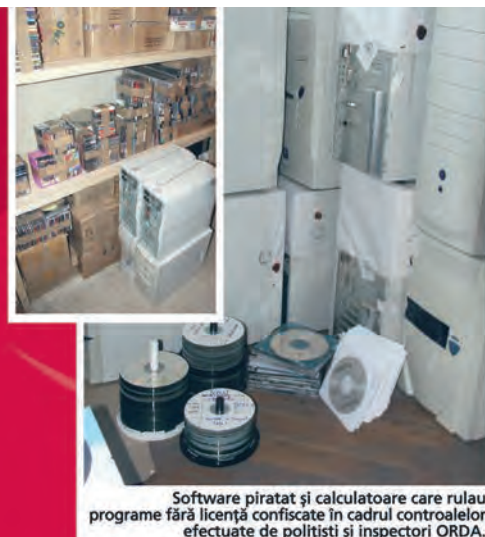
Software piratat și calculatoare care ruluau programe fără licență confiscate în cadrul controloarelor efectuate de polițiști și inspecții ORDA.