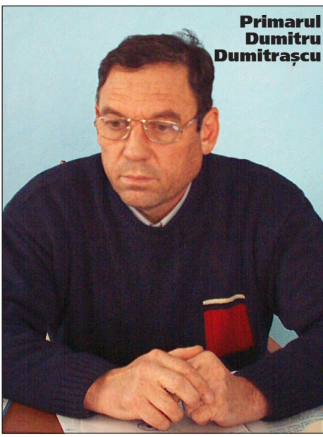
Primarul Dumitru Dumitrașcu

Surse studentești susțin că și rectorul Universității “Dunărea de Jos”, prof.univ.dr. Emil Constantin, ar fi fost luat la întrebări pentru greva studențească de la Galați. Tinerii precizează însă că acțiunea lor de protest nu este îndreptată împotriva universității gălățene, ci împotriva ministerului.