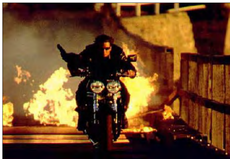
Cu: Tom Cruise, Ving Rhames, Thandie Newton. Titlu original: Mission: Impossible 2

Ethan Hunt (Tom Cruise) este un alt fel de agent 007, ceva mai tânăr, la fel de agil în aer ca pe pământ, care știe să se folosească de metode sigure pentru a elimina dușmanul. Cu ajutorul geniului în computere Luther Stickell și al unei hoaste pline de grație, agentul special Ethan Hunt îndeplinește o "misiune imposibilă" menită să oprească "o scârbă" înaintea ca aceasta să-și ducă la bun sfârșit operațiunea distructivă. Un joc al imaginației fertile, un montaj care alternează ritmuri diferite, imaginea șoc cu mișcarea în relanti, cu unghiuri de filmare care avantajează eroul, cu deflagrații șocante, gros-planuri ale sapei, o amprentă specifică stilului regizorului John Woo.