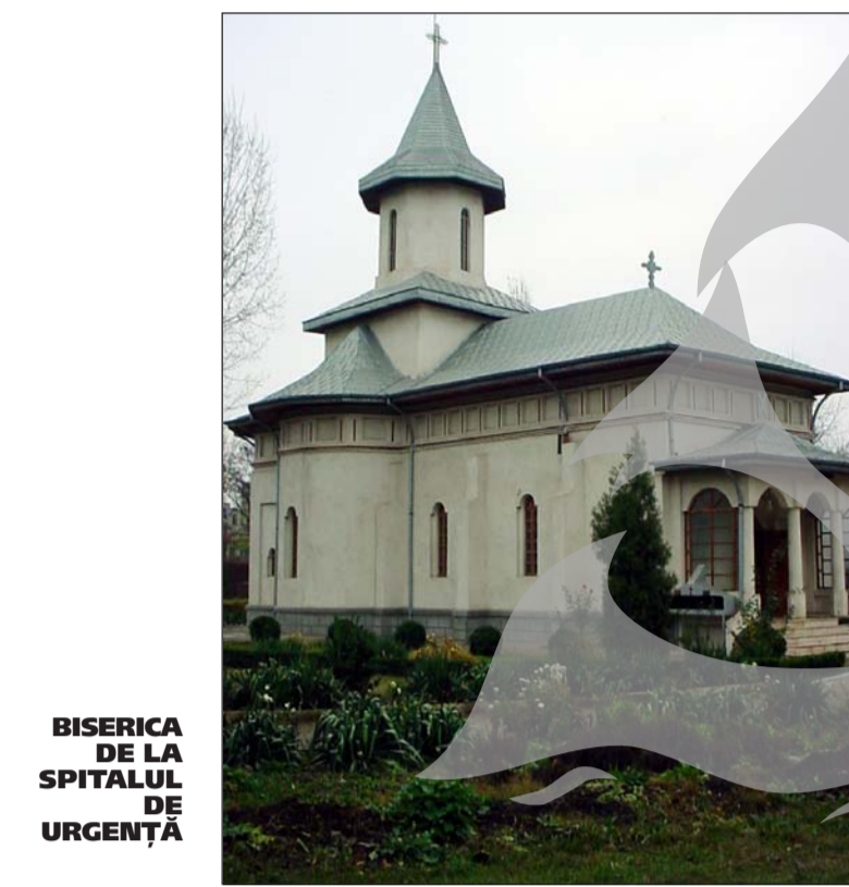
BISERICA DE LA SPITALUL DE URGENȚĂ

Un alt locaș închinat "Întăului propovăduitor al Evangheliei" se află la poarta celui mai mare combinat siderurgic din țară și din Europa - ISPAT SIDEX. Înlătată într-un timp relativ scurt