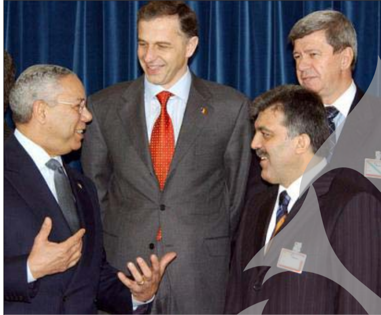
Irak, precum și problemele din spațiul mediteranean, din Caucaz și Balcani (inclusiv Georgia și Republica Moldova). Șeful diplomației române va participa, astăzi, tot la Bruxelles, la reuniunea Consiliului NATO-Ucraina și la cea a Consiliului de Parteneriat Euro-Atlantic (EPAC).