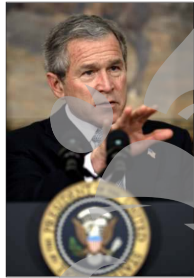
Washington, cu cei doi promotori ai Inițiativei de la Geneva.

Inițiativa de pace de la Geneva ar putea fi utilă dacă respectă principiile rezultate în urma negocierilor referitoare la procesul de pace din Orientul Mijlociu, a declarat, ieri, președintele american, George W. Bush, transmite AFP. "Inițiativa de pace ar putea fi folositoare", a declarat George W. Bush, care l-a primit, la Casa Albă, pe regele Abdallah al II-lea al Iordaniei. El a adăugat că trebuie respectate principiile referitoare la combaterea terorismului, la asigurarea securității și la instituirea unui stat palestinian liber și democratic. Această inițiativă de pace neoficială a fost lansată de foștii miniștri israelieni, Yossi Beilin, și palestinianii, Yasser Abed Rabbo, și este considerată drept "o eroare" de premierul Ariel Sharon. Secretarul american de Stat, Colin Powell, se va întâlni, astăzi, la