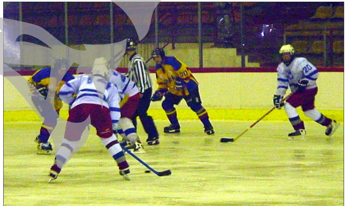
Meciurile de hochei atrag prin spectaculozitatea fazelor create...