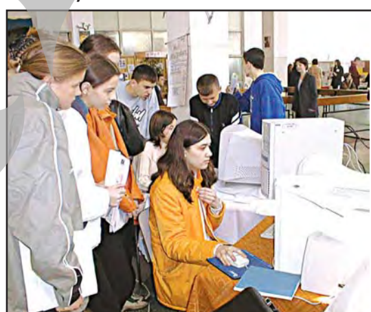
VARIA PAG. 5