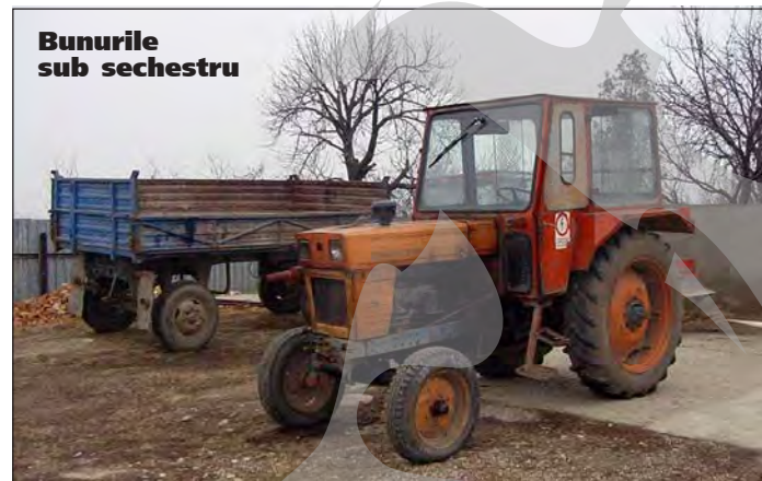
Bunurile sub sechestrul

ASIGURĂRI ATCLASSIB noi preluăm riscul Cel mai bun randament în rezolvarea daunelor RCA! *cf "Anuarul auto 2003"