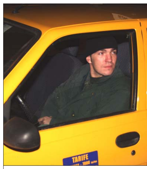
Florin face taximetrie cu mașina lui

Tarife mici, servicii prompte Cu toate că au parte și de curse cu probleme, taximetristii își iubesc meseria și o fac cu plăcere. Sunt ore întregi de stat la volan, de alergat pe drumurile pline de hârtoape, pe ploaie, frig, zăpadă sau căldură toridă. S-au îndrăgostit de taximetrie și cu greutate ar putea să opteze pentru altceva. Simt că sunt făcuți pentru asta. Fiecare zi și noapte de lucru înseamnă întâlnirea cu colegii, poante, bancuri noi (transmise