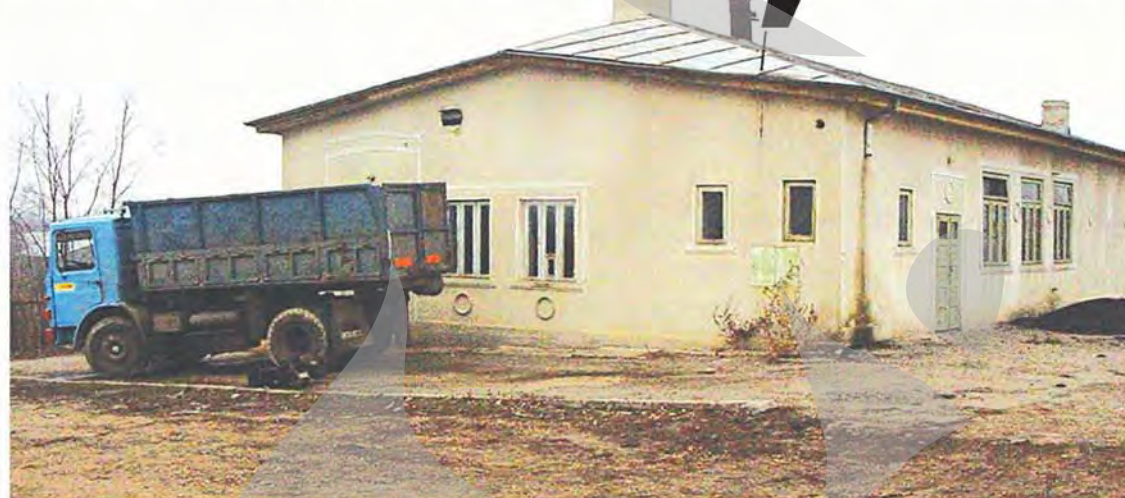
Brutăria sechestrată de Primărie