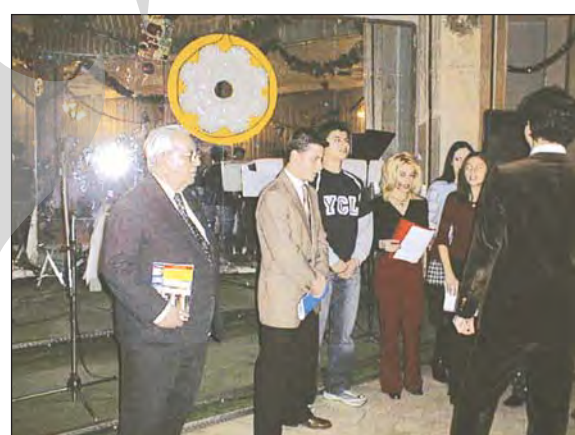
PANĂ LA ZI PAG. 3