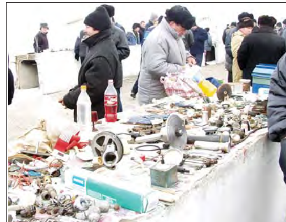
IMPACT PAG. 14