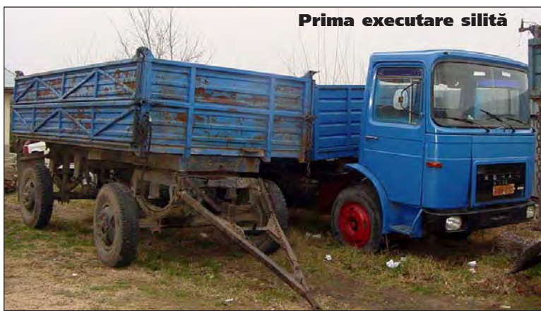
Prima executare silită

Recent, am fost sesizați că primarul din Ivesți (comună pe raza căreia se