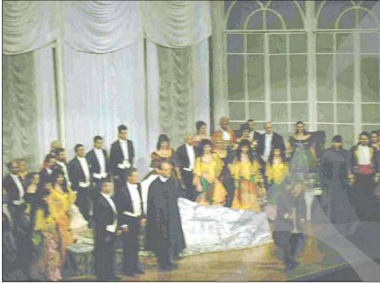
Este o bucurie și pentru noi să primim astfel de ecouri din Germania. Nu este pentru prima oară - și vrem să credem că nici pentru ultima oară - când artiștii de la Teatrul Muzical ne reprezintă cu cinste în turneele peste hotare.