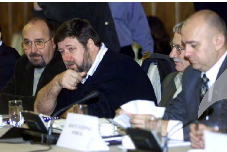
Post analizate pozițiile reprezentanților ministeriale care "de multe ori resping

Democrații consideră că negocierile României cu UE nu trebuie oprite, liderul PD, Traian Băsescu, acuzându-i pe europarlamentarul Arie Oostlander și pe raportorul european al Parlamentului European pentru România, Emma Nicholson, de "incorectitudine" față de țara noastră.