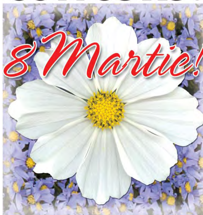
"În inima fiecărei femei există o scânteie din focul ceres"