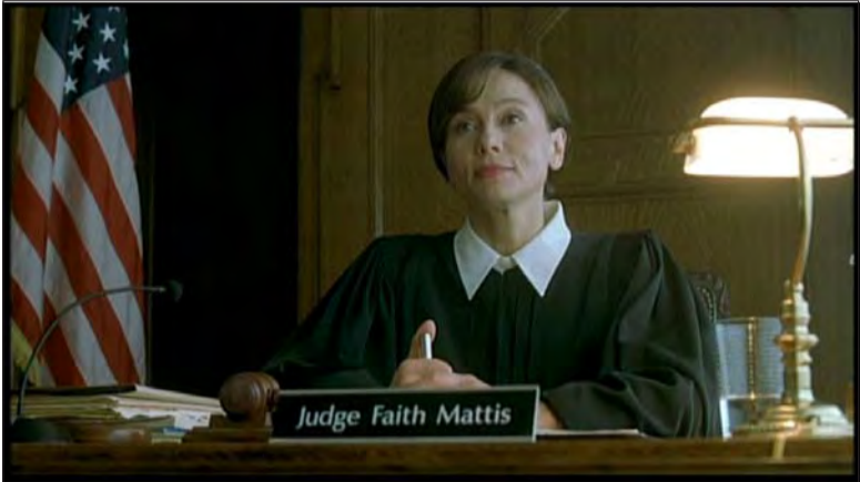
Cu: Bill Pullman, Lena Olin. Titlu original: Ignition

(dramă, SUA-Canada, 2001) HBO, ora 21,40