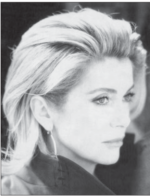
Cu: Catherine Deneuve, Vincent Lindon, Mathilde Seigner. Titlu original: Belle Maman

(comedie romantică, Franța, 1999) TVR 2, ora 23,00