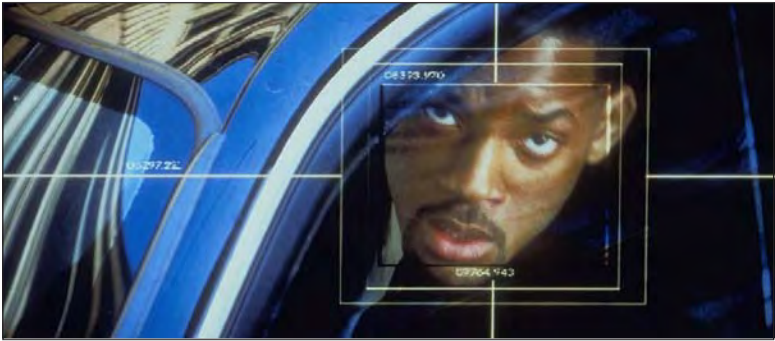
Cu: Will Smith, Gene Hackman, Jon Voight. Titlu original: Enemy of the State

Avocatul Robert Clayton Dean (Will Smith) e tânăr, familist convins și dornic de afirmare. O întâmplare întâmplătoare cu un vechi prieten îl transformă viața în iad. Identitatea îi este furată de un șef al Agenției Naționale de Securitate,