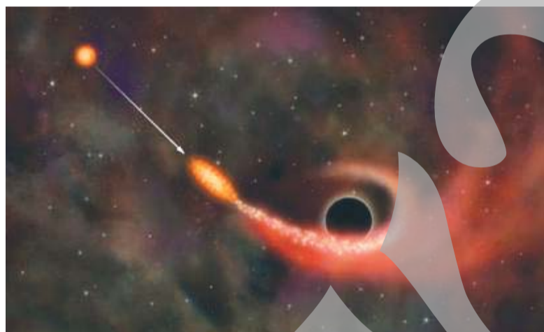
sfâșiată. Această descoperire furnizează informații cruciale cu privire la modul în care aceste găuri negre se măresc și afectează stelele și gazele înconjurătoare, a declarat responsabilul de la NASA.

Doi sateliți au adus pentru prima dată dovada unei imense găuri negre care sfâșie și absoarbe o parte dintr-o stea, a anunțat miercuri un responsabil de la NASA, citat de site-ul Yahoo!News. Evenimentul înregistrat de observatoarele spațiale cu raze X Shandra de la NASA și XMM-Newton de la Agenția spațială europeană (ESA) a fost prevăzut teoretic de foarte mult timp, dar niciodată confirmat, a precizat agenția spațială americană într-un comunicat. Potrivit astronomilor, steaua s-a apropiat prea mult de imensa gaură neagră după ce a fost împinsă de pe ruta sa de o altă stea. Atunci când se apropia de câmpul gravitațional al găurii negre, ea a fost atrasă de forțele contrarii, asemănătoare celei de pe Lună, care provoacă marea de pe Terra, până când steaua ajunge să fie