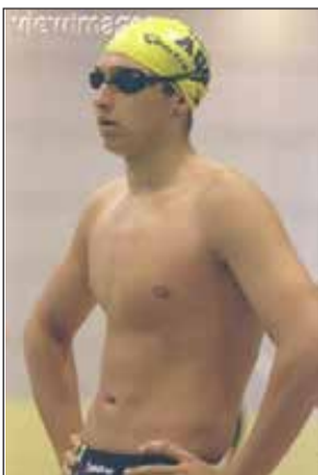
fost descalificat la campionatele naționale ale Australiei, criteriul de selecție pentru Olimpiadă, din cauza unui start ratat, și nu-și va putea apăra titlul la Atena.

b "My Side" , autobiografia fotbalistului echipei Real Madrid, David Beckham, a fost premiată în cadrul unei festivități care a avut loc la Londra. Cartea internaționalului englez a fost desemnată "autobiografia cu cele mai rapide vânzări din toate timpurile". "My Side", care fusese nominalizată la categoria "cea mai bună carte a anului în Marea Britanie", a fost vândută în 103.000 de exemplare în doar prima săptămână de după lansare, iar până în prezent s-au vândut peste un milion de exemplare. b Printul Albert de Monaco a declarat că AS Monaco așteaptă, "în zilele următoare", răspunsul final al unui nou investitor, care să asigure continuitatea clubului. Printul a precizat însă că investitorii străini nu pot deveni acționari majoritari ai clubului. AS Monaco are datorii de peste 53 de milioane de euro. b Raportul final al autopsyei fostului atacant al echipei Benfica Lisabona, Miklos Ferenc, care a decedat, pe 25 ianuarie, în urma unui stop cardiac suferit în timpul unui meci, a fost remis Ministerului Justiției din Portugalia. În raport se arată că Feher a decedat din cauza unor probleme cardiace nedepistate și că în cadavrul său nu a fost depistată nici o "urmă toxicologică". Cazul urmează să fie clasat, deoarece a fost vorba despre o situație imprevizibilă pe care echipa medicală a clubului nu putea să o detecteze.