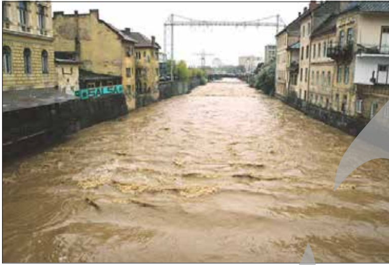
comună, 300 de hectare de pășune și un pod. Totodată se acționează pentru

dintr-un drum județean, după revărsarea râurilor Crișul Alb, Ribița și Crișani. Alte patru localități din județ și 40 de hectare de teren agricol au fost afectate ca urmare a revărsării apelor râurilor Mureș și Almaș. Tot în Hunedoara, șase gospodării din localitatea Crișani au fost izolate, după ce podul de acces s-a rupt, iar circulația între Petroșani și Târgu Jiu se desfășoară pe un singur sens, întrucât apele Jiului au avariat zidul de sprijin. În județul Timiș, revărsarea apelor râului Bega a afectat două comune, 40 de hectare de teren agricol și două anexe gospodărești. Ploile căzute în județul Vrancea au afectat cinci comune, înundând 15 locuințe și anexe gospodărești, 50 de hectare de teren agricol, un pod și un drum forestier. În județul Vaslui, precipitațiile au afectat o