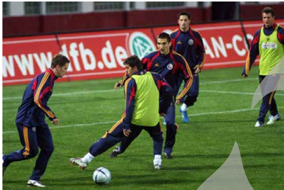
Fază de la antrenamentul de ieri al "tricolorilor"

b Bilanț negativ cu echipa lui Rudi Voller b La oaspeți va evolua și Ballack b Printre "tricolori" se află și gălățeanul Sorin Ghionea b Prețul biletelor - între 150.000 și 1,5 milioane lei b Meciul va fi transmis de TVR 1