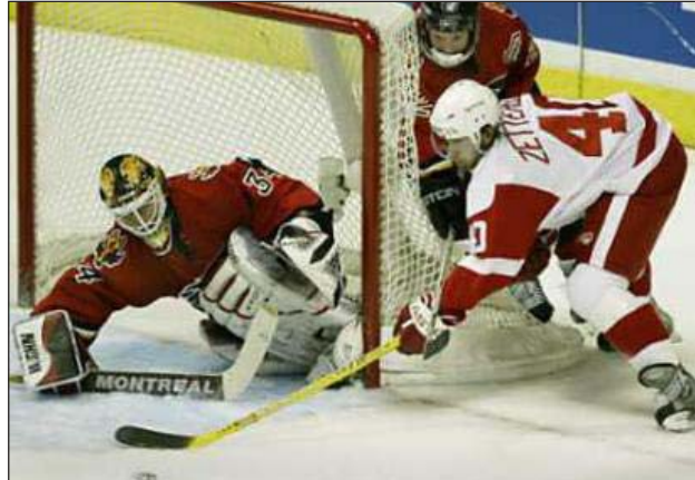
Fază din liga profesionistă nord-americană de hochei pe gheață

HOCHEI. Rezultate înregistrate în partidele din semifinalele conferințelor play-off-ului ligii profesioniștii nord-americane de hochei pe gheață (NHL), care se desfășoară după sistemul "cel mai bun din șapte meciuri": Montreal - Tampa Bay 3-4 (Tampa conduce la general cu scorul de 3-0), Calgary - Detroit 3-2 (2-1).