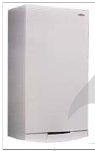
care nu-și vor putea permite o asemenea investiție, va rămâne doar cu visul unei centrale proprii...