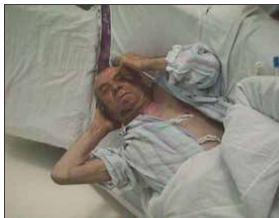
SOCIAL PAG. 8