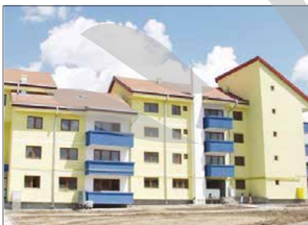
REFORMA PAG. 4