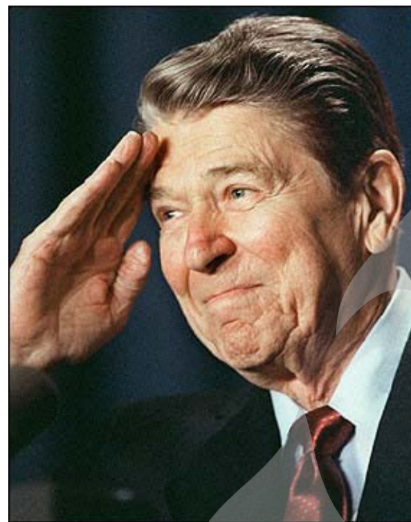
În 1981, Reagan a fost ținta unei tentative de asasinat, fiind împușcat de un dereglat mintal, care spunea că dorise să o impresioneze pe actrița Jodie Foster prin asasinarea președintelui. Glonțul său doar l-a rănit, însă, pe președinte, care s-a refăcut după o intervenție chirurgicală.

Franța "nu va uita niciodată ce le datorează americanilor" și aliaților care au eliberat Europa, a declarat, ieri, președintele francez, Jacques Chirac, în Normandia, în timpul ceremoniilor de la cimitirul franco-american de la Colleville-sur-mer.