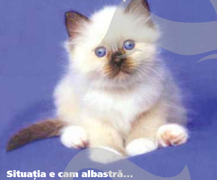
Situația e cam albastră...