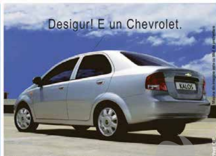
Desigur! E un Chevrolet.

Iată o mașină care arată foarte bine și care acoperă nevoile întregii familii. Are un preț accesibil?