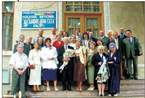
CULTURĂ PAG. 5