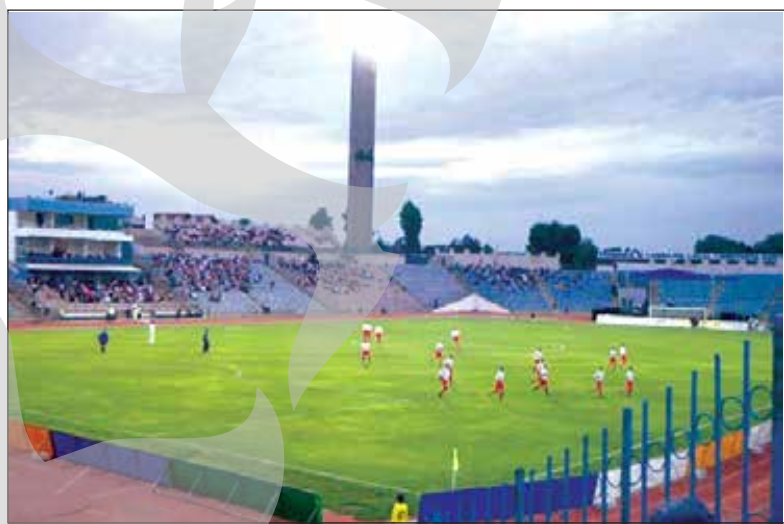
În fotografie: Stadionul "Gheorghe Hagi" din Constanța

■ Adică, la Constanța... ■ Lotul echipei gălățene trebuie definitivat până pe 7 iulie