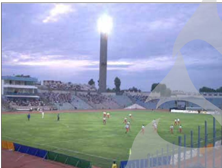
Stadionul "Gheorghe Hagi" din Constanța, unde Oțelul va susține meciul de debut din ediția 2004/2005 a Cupei UEFA

Pentru meciul cu echipa albaneză, lista jucătorilor eligibili ai formației gălățene pentru turul întâi preliminar trebuie să ajungă la UEFA până pe data de 7 iulie. Lotul trebuie alcătuit însă ceva mai devreme, pentru că Oțelul urmează să înainteze lista Federației Române de Fotbal, care o va remite, după aprobare, forului european în timpul respectiv. Mai trebuie spus că la UEFA vor ajunge, de fapt, două liste, pe lângă cei 25 de jucători care se vor afla pe "lista A", o "lista B" urmând să cuprindă jucătorii echipei de tineret (născuți după 1 ianuarie 1983), care în caz de necesitate pot evolua în competiția continentală sub culorile echipei gălățene. În plus, pentru primele două tururi prelimiare ale Cupei UEFA, lista jucătorilor eligibili poate fi modificată, tot prin intermediul FRF, până cu 24 de ore