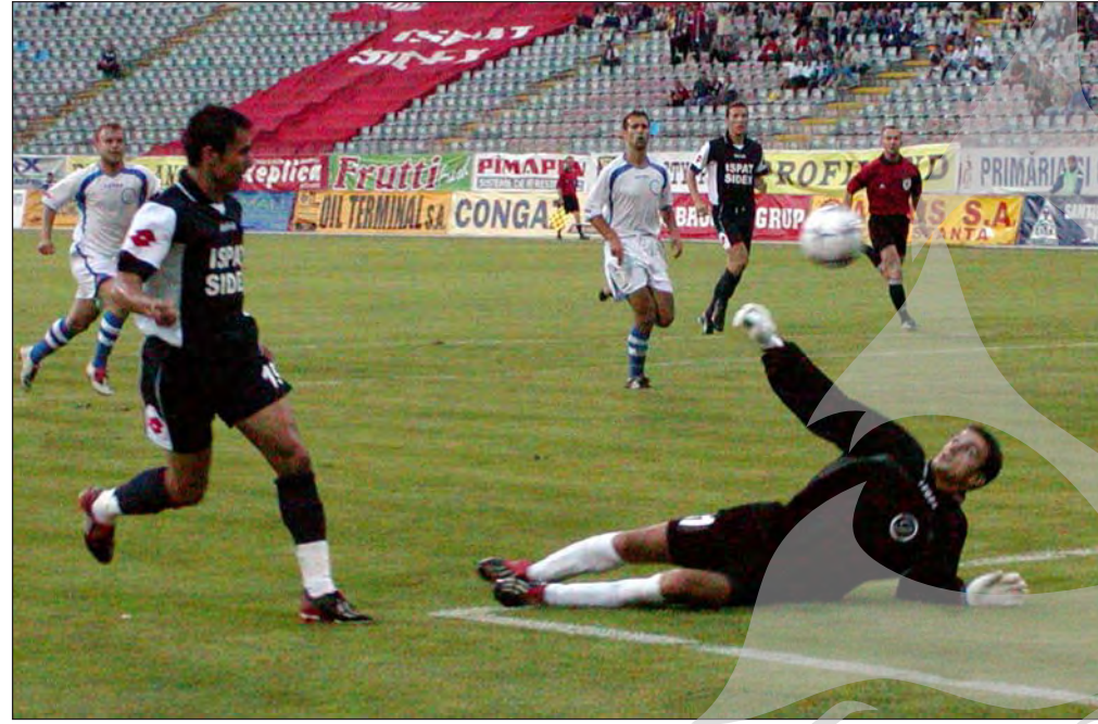
Fază din meciul Oțelul - Dinamo Tirana 4-0 (4-0)