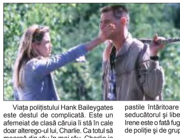
Cu: Jim Carrey, Renée Zellweger. Titlu original: Me, Myself & Irene