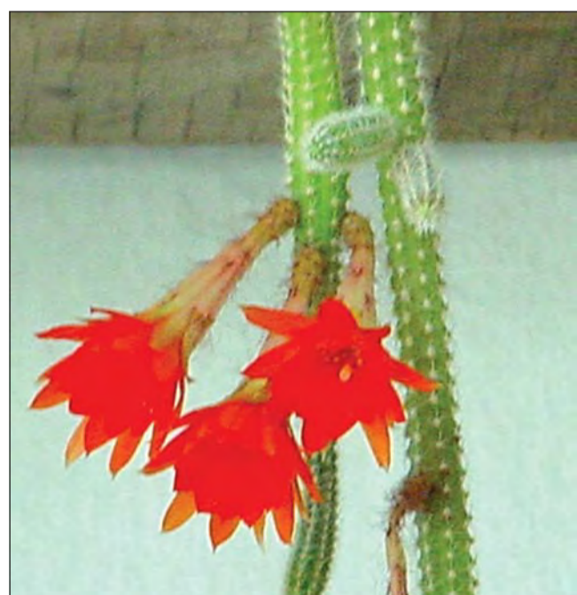
Clipa irepetabilă a înfloririi