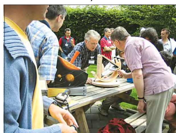
CULTURĂ PAG. 5