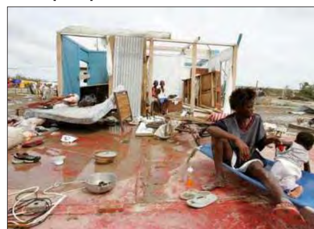
LUMEA PAG. 17