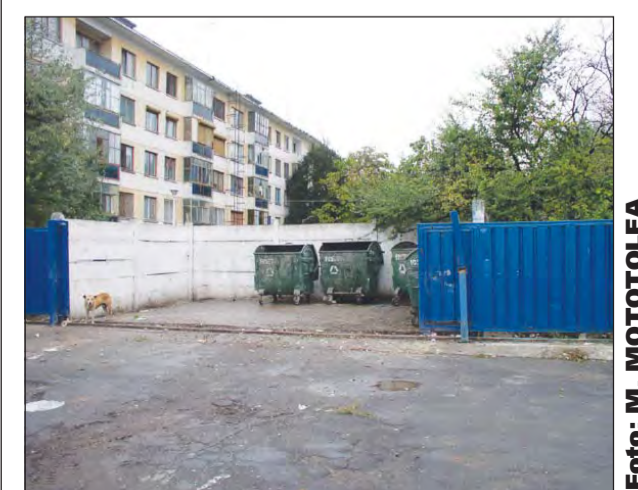
SOCIAL PAG. 7