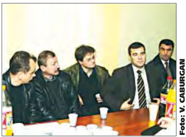
VARIA PAG. 5