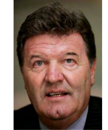
campionatului Argentinei. Fost jucător al grupării, Benitez urmează să asigure interimatul până la încheierea turului, pe 12 decembrie. Ulterior, funcția de tehnician al formației argentinene ar putea fi preluată de Alfio Basile sau de Marcelo Bielsa.

■ Tehnicianul Jorge Benitez a fost numit în funcția de antrenor interimar al echipei argentinienne Boca Juniors. Benitez l-a înlocuit pe tehnicianul Miguel Angel Brindisi, care a demisionat după meciul pierdut în fața formației River Plate (scor 2-0), în etapa a XIV-a a