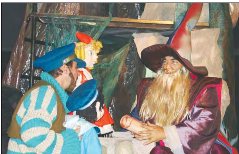
"Fergie și floarea fermecată"

"Dar a pune în scenă un spectacol pentru copii este întotdeauna o formă de regenerare suflatească, de încercare a bateriilor copilăriei care țin copilul din noi treaz astfel încât să nu ne sclerozăm de tot". (Bogdan Drăgulescu)