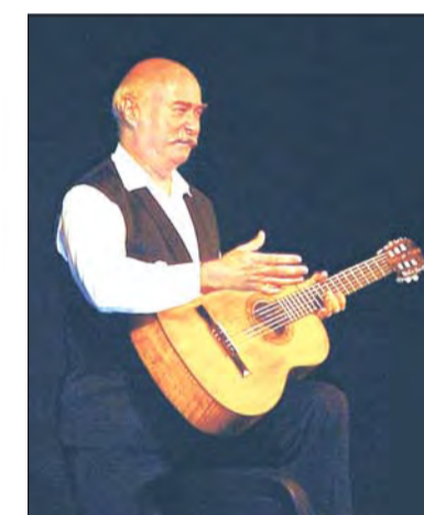
Miercuri, la ora 19.00, Tudor Gheorghe va fi prezent pe scena Casei de Cultură a Sindicatelor din Galați cu cel mai nou recital, intitulat "Niciodată toamna..."

Este pentru gălățeni un nou prilej de reînținerire cu îndrăgitul solist care s-a bucurat, la fiecare venire a sa în orașul nostru, de un succes incontestabil. Biletele se găsesc la Casa de Cultură a Sindicatelor, la prețuri cuprinse între 200.000 de lei și 300.000 de lei de persoană.