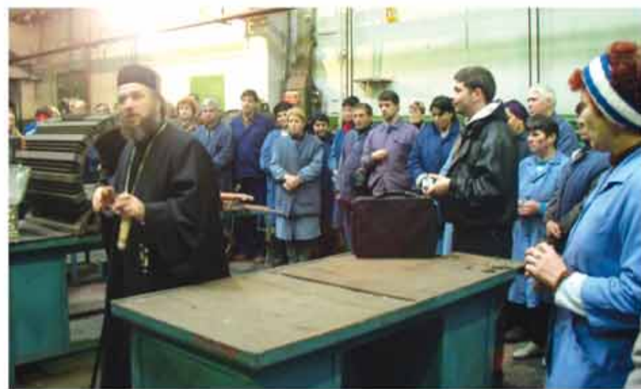
EVENTIMENT P.7