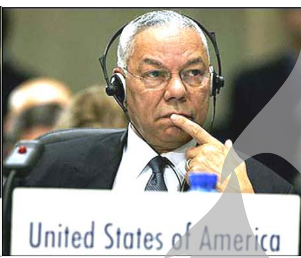
United States of America

ratifica Tratatul asupra forțelor convenționale din Europa, din 1999.