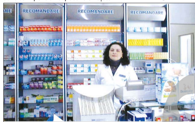
Sensiblu Țiglina I