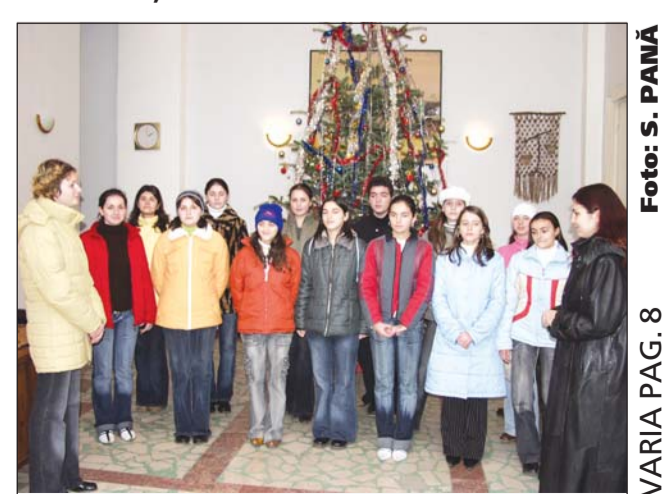
VARIA PAG. 8