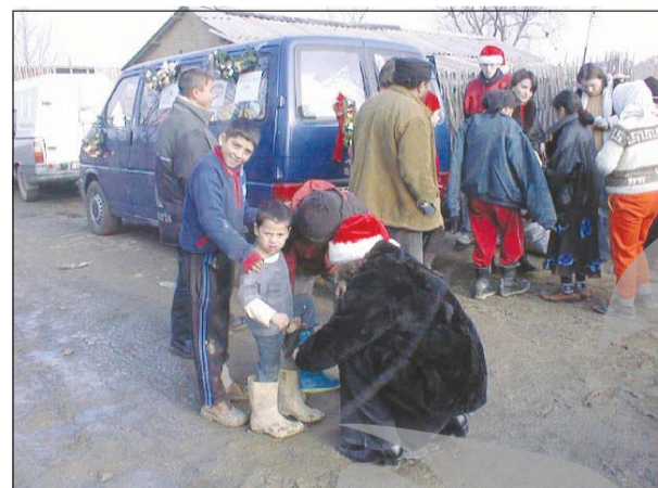
VARIA PAG. 6