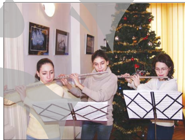
EVENTIMENT PAG. 3