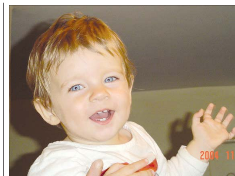
Patru dinți din față