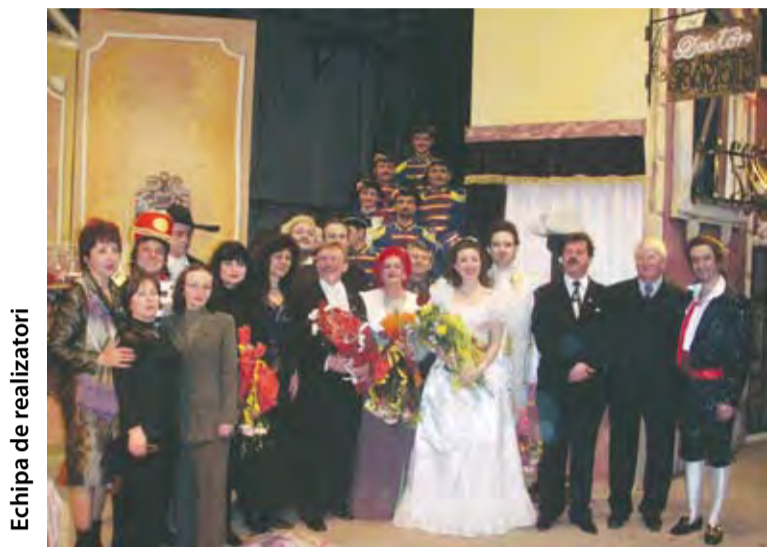
Echipa de realizatori