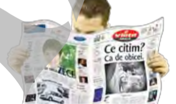
COMUNICAT DE PRESĂ Astral Creșterea evoluează