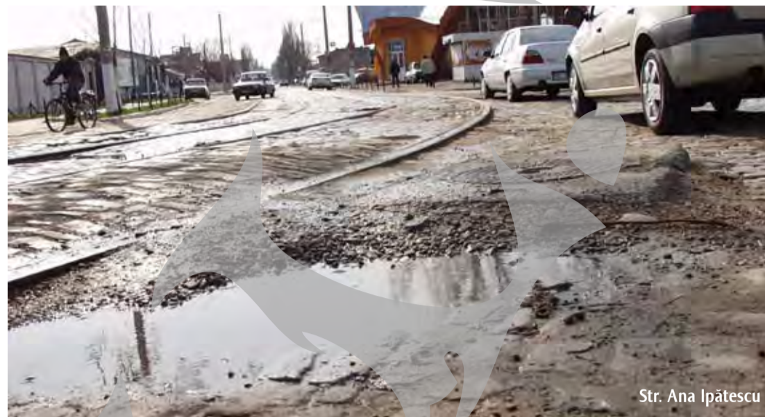
Str. Ana Ipătescu

Ideea e că șoferii mai au de cutreierat multe gropi, mai au de îngropat multe mașini până când își vor putea permite să renunțe la vocabularul cu adevărat trivial.