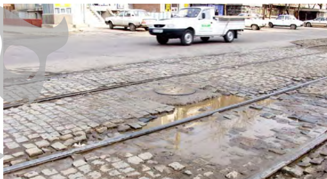
Pasaj Două Babe