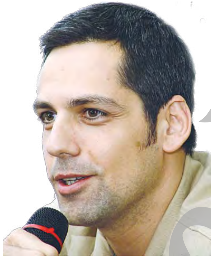
justifică suma de 350.000 de lei necesară pentru achiziționarea unui bilet. „Și nu întotdeauna este și profitabil. Ca să nu mai vorbim de faptul că, tehnic sunt greu de realizat: neavând fon-

duri externe, suntem obligați să mergem din oraș în oraș, fără a ne întoarce în Capitală decât într-o singură zi când avem programată și o conferință de presă. Orașele în care vin să cânt nu le-am ales întâmplător”.