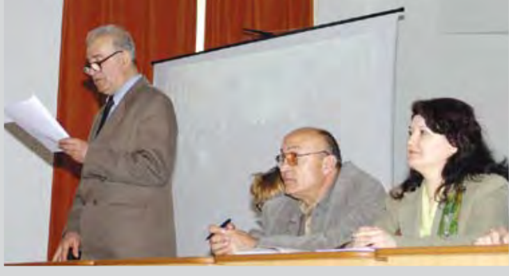
Simpozion dedicat lui Dimitrie Cuclin