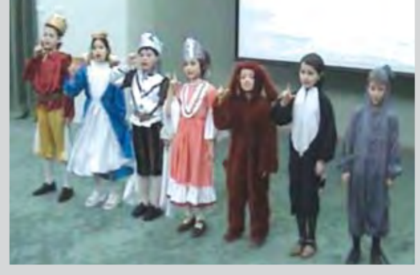
Puștani care vor să plece în Italia...

Astăzi se deschide Târgul de oferte educaționale