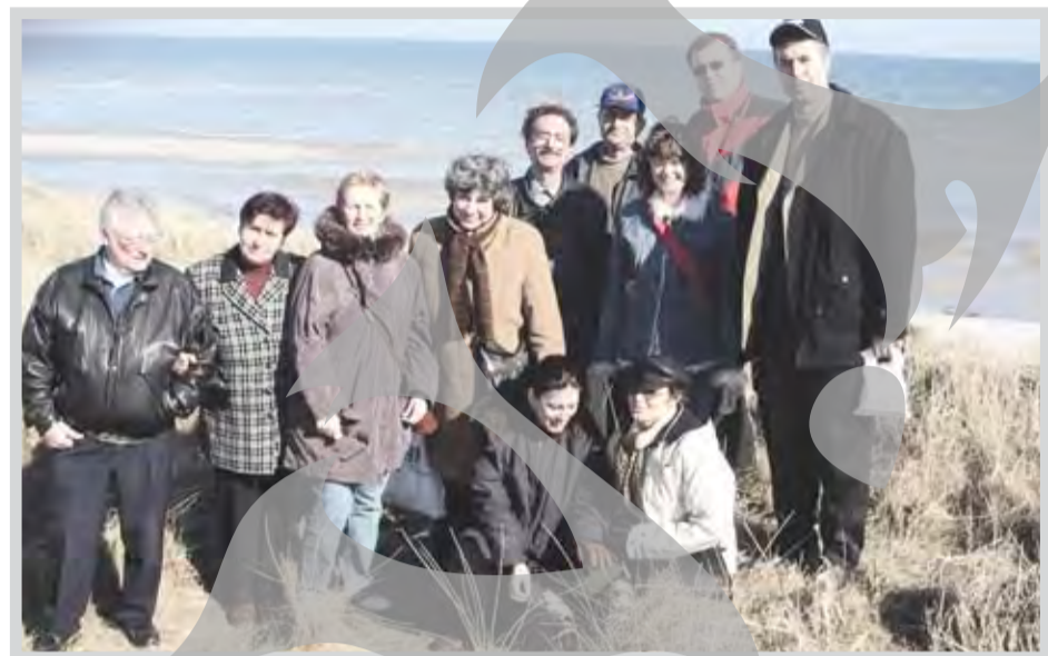
Gălățeni la Marea Nordului

cauza climatei, în Danemarca nu se coc strugurii. Așa că, dacă vrei să faci cuiva de acolo o bucurie, oferă-i o sticlă de vin! Așa și-a făcut domnul Julei o mulțime de prieteni în Danemarca.