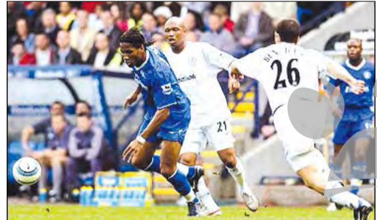
după Cupa Ligii Angliei.