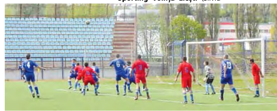
Fază din meciul Politehnica - Voința Cudalbi (etapa a 21-a), în care gălățenii s-au impus cu categoricul scor de 12-2

dorește să rămână la AS Roma, echipă cu care se află sub contract până în 2008.