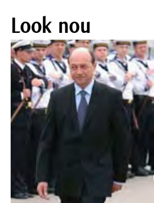
La îndemnul soției, președintele și-a schimbat frizura, tăindu-și "șuvița"

Mai mult de 3.500 de copii se află printre sinistrații rămași fără case în urma inundațiilor din județele Timiș și Caraș Severin, autoritățile fiind nevoite să facă față mai multor probleme pentru ca ei să poată duce în continuare o viață normală.