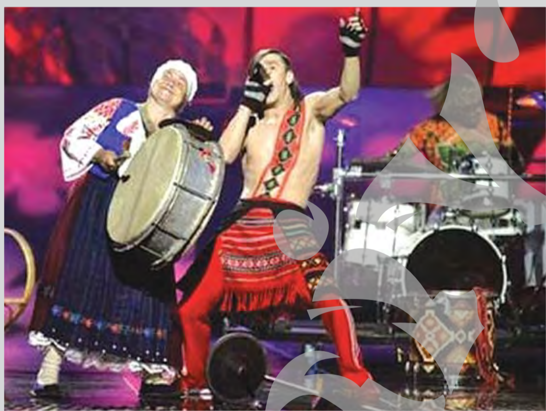
Zdob și Zdob, alături de "boonika" lor

După ce au trecut de semifinala de joi, reprezentanții României au mai scăpat de emoțiile concursului și s-au apropiat de ultima etapă de sâmbătă cu încredere