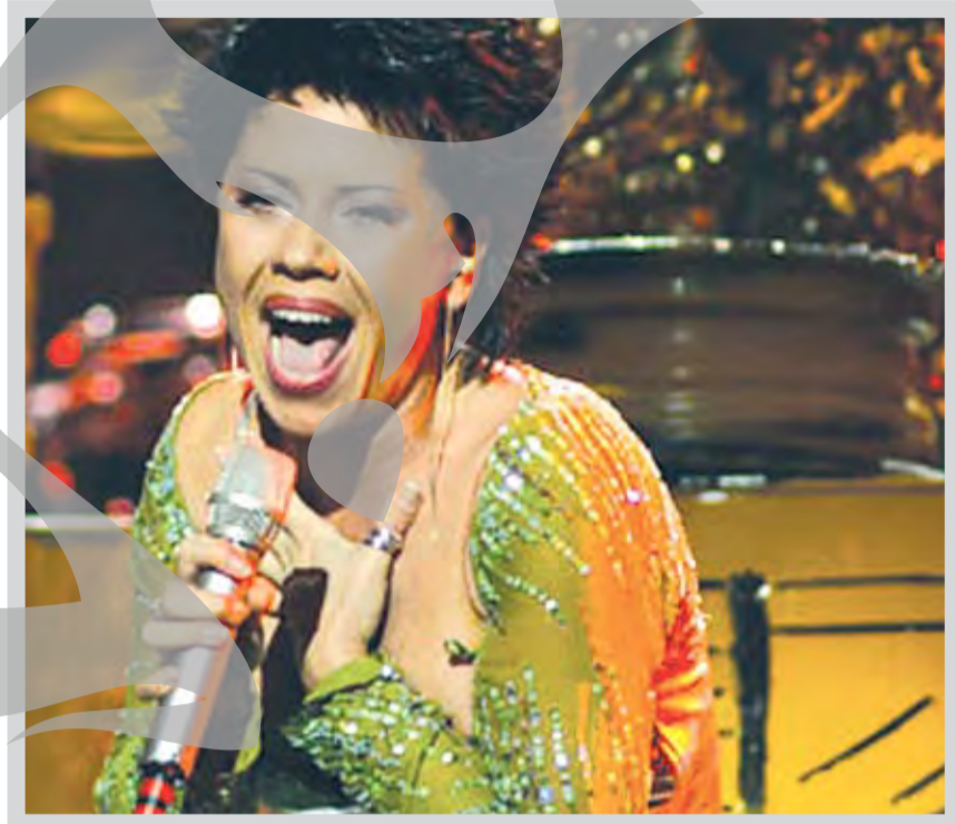
Luminița - cea mai bună participare românească din istorie

O premieră a acestei ediții este faptul că așa-numitele țări "Big 4" - Spania, Marea Britanie, Franța și Germania -, calificate din oficiu în finalele Eurovision, s-au clasat pe ultimele patru poziții!