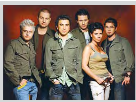
Luminița Anghel și Sistem - "Let Me Try"