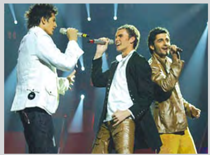
Serbia și Muntenegru - cea mai bună prestație din spațiul ex-ugoslav