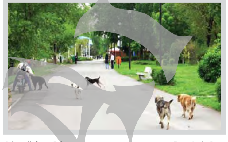
Prieteni de pe Faleză