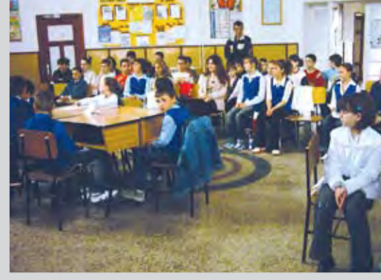
Concursul "Clasa europatru" la Școala Nr. 12

Ultimul film din seria "Star Wars" a stabilit un record în istoria cinematografiei: încasări din bilete în valoare de 50 de milioane de dolari într-o singură zi, conform FoxNews. "Star Wars: Episodul III - Răzbunarea Sith" a încasat, joi, când a început să ruleze în SUA, 50.013.859 de dolari din vizionări, inclusiv din spectacolele speciale programate la miezul nopții, conform unui cercetător de box-office de la Exhibitor Relations. Suma a bătut fostul record de încasări într-o singură zi, realizat în mai 2004 de filmul "Shrek 2", încasările fiind atunci de 44,8 milioane de lei într-o zi de sâmbătă.