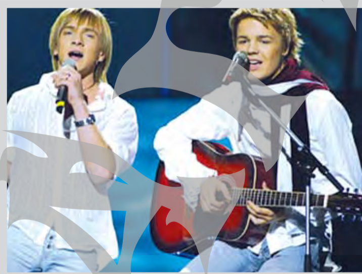
Reprezentanții Letoniei - ocupanții locului 5

Sâmbătă seara, și Republica Moldova a reușit performanța de a se califica la ediția viitoare, după prima participare la Eurovision. Zdob și Zdob și "Boonika bate doba" au plasat Moldova pe locul șase cu 148 puncte. Roman Iagupov, liderul trupei, a adoptat o ținută puțin diferită față de semifinală: a urcat pe scenă îmbrăcat doar cu niște catrințe, renunțând la tricou. Iagupov a apărut așa pentru prima dată la repetițiile de vineri, stârnind uimire în rândul fanilor și al ziaristilor. Moldova a primit în finală