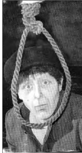
Scenă din spectacol