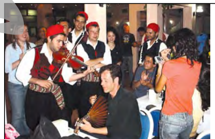
► Schimb de experiență. “Folclor cocktail”: punem un acord în macedoneană, unul în grecește, adăugăm un ritm din Moldova și ceva versuri în turcește. Culmea, nu sună rău!