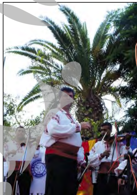
► “Măi, tată, aici sunt mai mulți palmieri decât avem noi plopi!” Dar “Ciocărlia” sună la fel de bine și sub palmieri, iar dacă mai vine și o doină sau o tropăit, te simți ca acasă.

“Soare, mare, palmieri, costume multicolore, cântec, dans și, mai ales, prietenie fără frontiere” - aceasta a fost formula care a asigurat succesul Festivalului Internațional al Tineretului organizat de Universitatea EGE din Izmir (Turcia). Ansamblul “Doina Covurluiului” al Centrului Cultural “Dunărea de Jos” a fost și el prezent la această sărbătoare. Despre spectacolele susținute de gălățeni am scris deja în paginile ziarului nostru. În cele ce urmează, “click”-ul aparatului foto ne permite să aruncăm o privire și în culisele festivalului: