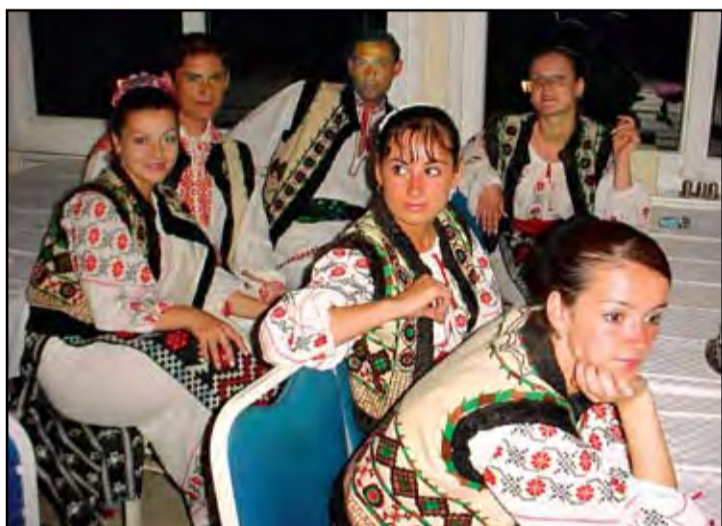
► După suitele de dansuri din Moldova, mai este nevoie și de un moment de odihnă. Nu pentru mult timp însă pentru că deja un nou spectacol se află în pregătire.