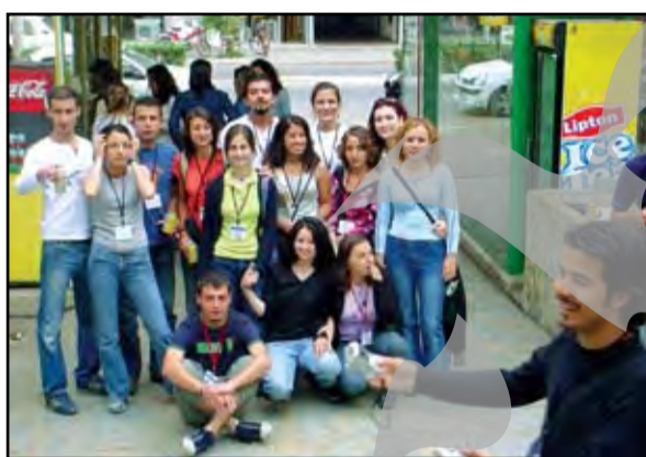
► Fotografie “de familie” cu studenții din Izmir. Au alergat săracii, numai ei știu cât. Totul e bine când se termină cu bine. Bravo lor!