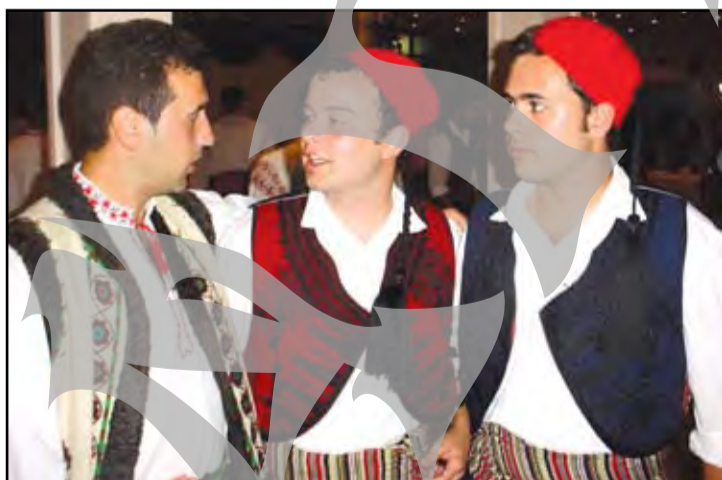
► “Do you speak English?” Mai în engleză, mai în franceză, mai din... gesturi, toți și-au găsit până la urmă o limbă comună. În definitiv, prietenia nu are nevoie de multe cuvinte.