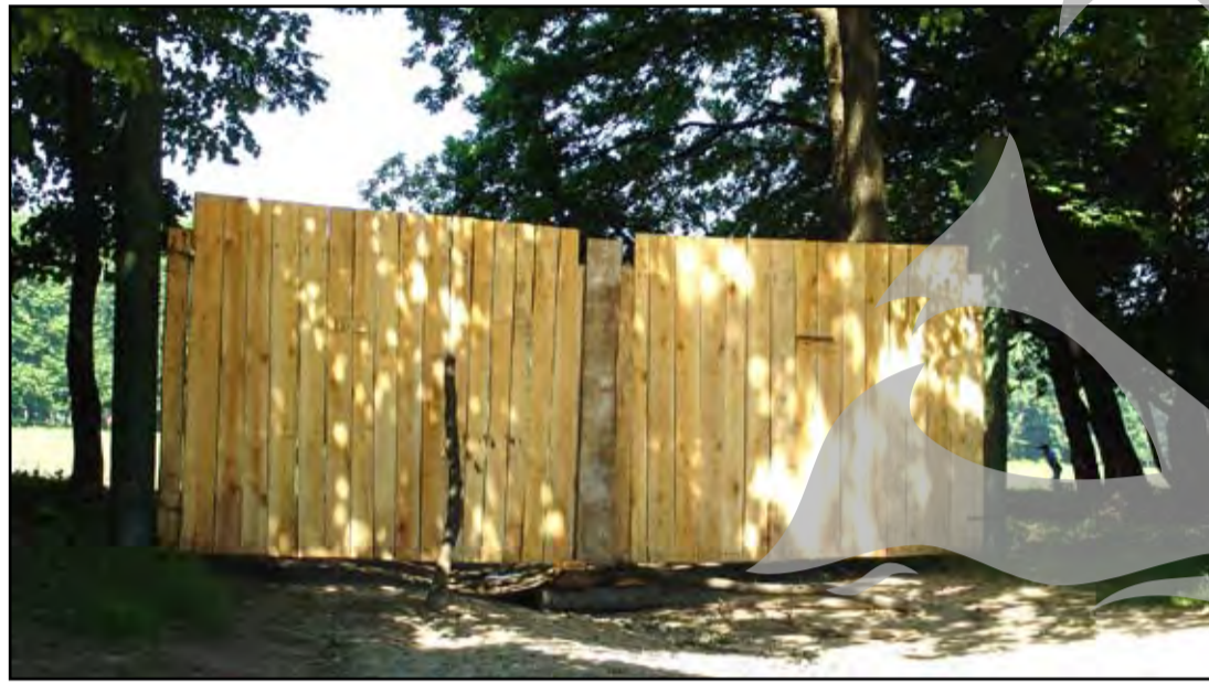
Porta care blochează drumul de acces

● Fără milă, fără scrupule - jaf ca în codru