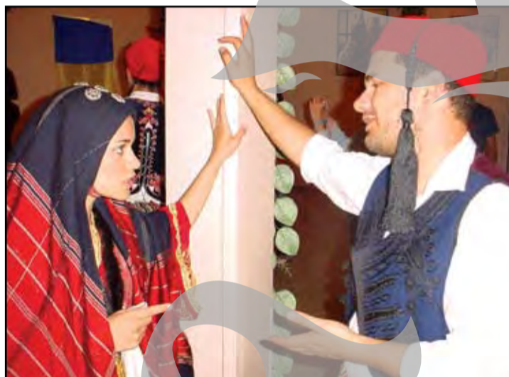
► Ultimele amănunte coregrafice sunt puse la punct. “Știi ce ai de făcut...”, pare a spune artista din Grecia. “Bine, bine, dar cu Zorba cum rămâne?”