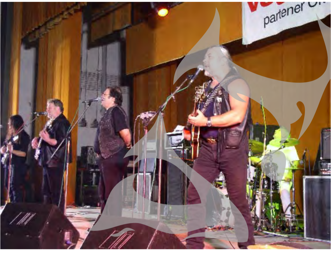
mulțumim artiștilor fiindcă sunt, fiindcă nu s-au dat bătuți, fiindcă pot și vor în continuare să cânte singurul fel de muzică ce merită ascultat: muzica bună. La final, Nicu Covaci le-a dat gălătenilor care vor să-i mai vadă în concert un sfat, pe care-l reproducem și noi: „Mergeți la primar și spuneți-i că vreți să vină «Phoenix»”. Primarul să organizeze, că noi venim să facem ce știm mai bine: să cântăm!” Anca Spănu Tudor

ta este un aspect minor, comparativ cu indiscutabila calitate a prestației muzicale. Două ore de spectacol uluitor, în care, între melodii, publicul își ținea respirația, abia putând aștepta următoarele acorduri. La un moment dat, cineva din public, găsind așteptarea prea lungă, a întrebat „Ce se întâmplă, domnule?”, la care Nicu Covaci, cu umorul înconfundabil, a replicat: „Ce să se întâmple? Concert «Phoenix»!”, fiind răsplătit cu hohote de râs și aplauze furtivoase. Doar căldura a pus probleme, dar cine a mai stat să se gândească la asta? E uimitor cum reușesc acești oameni, pe care destinul i-a alungat din țară pentru lung timp, permițându-le apoi să se întoarcă tot în săli pline, de parcă n-ar fi trecut aproape o viață de om, să stimuleze sensibilitatea unor români (dar nu numai) din generații atât de diferite. Să fie oare exploatarea inteligentă a filonului folcloric cheia succesului lor? Sau tehnica impecabilă - noul membru al trupei, tânărul chitarist Cristi Gram, a dovedit că merită cu prisosință încrederea lui Nicu Covaci, Ovidiu Lipan, loji Kupaș și Mircea Baniciu - mereu pusși în slujba unor linii melodice originale, profunde? Indiferent care e secretul, rezultatul se vede și se aude: „Phoenix” renaște mereu, mai mândră după fiecare concert! Nouă, muritorilor de rând, nu ne rămâne decât să le