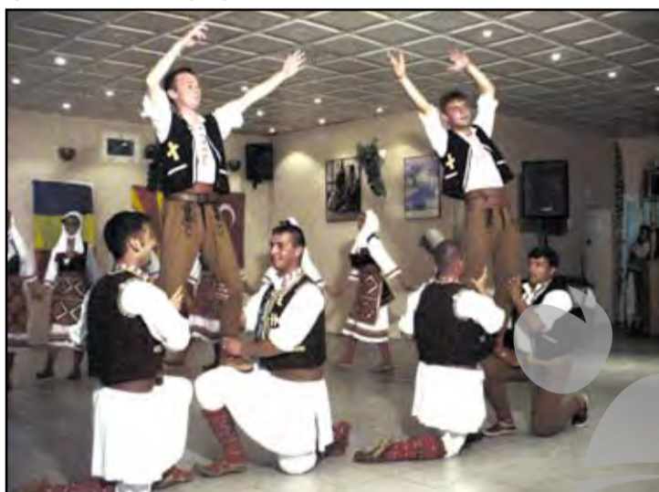
► Dacă-i dans, dans să fie! Un moment acrobatic în stil popular macedonean nu poate decât să anime și mai mult atmosfera.