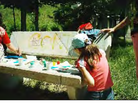
Copii de Ziua Mediului