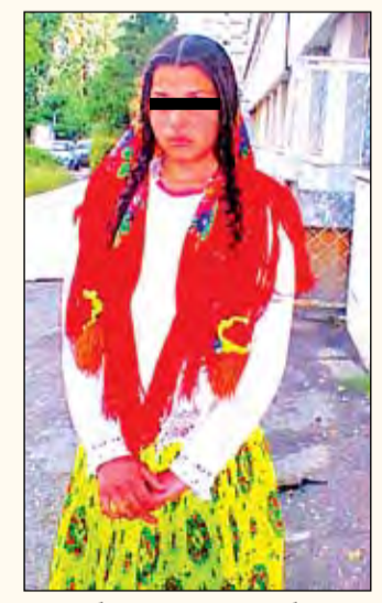
► Kidnapping ca la ușa cortului ► Răpire, sechestrul și viol fără probe