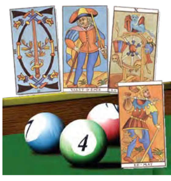
Laura Gurău CONTINUAȚE ÎN PAGINA 9

speculații, unii spun că au fost la un pas de mare câștig (dar numerele au ieșit, din păcate, pe variante diferite!), iar alții încearcă, pe diverse căi, să afle numerele câștigătoare de la următoarea extragere. Cum?