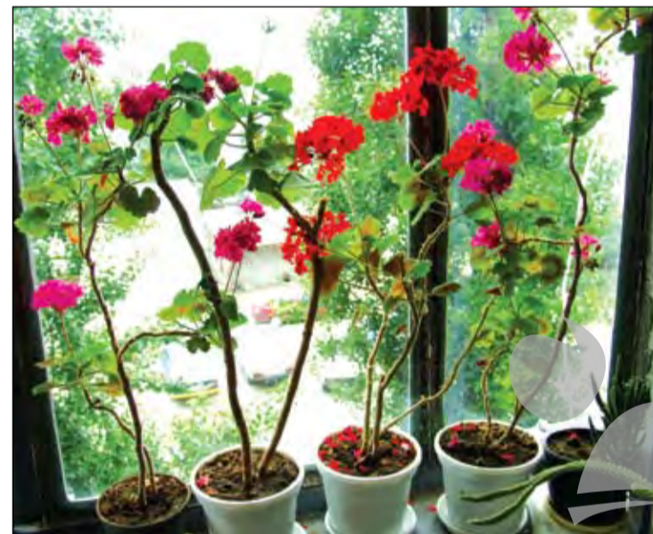
Mușcata din fereastră