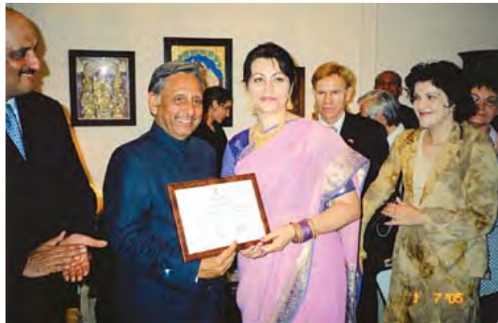
Împreună cu ministrul Mani Shankar Aiyar