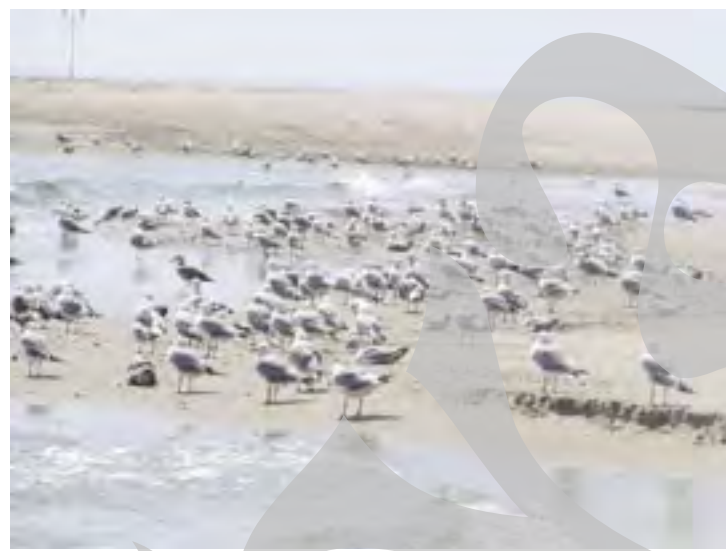
Locuitori cu aripi pe plaja prezidențială de la Neptun.