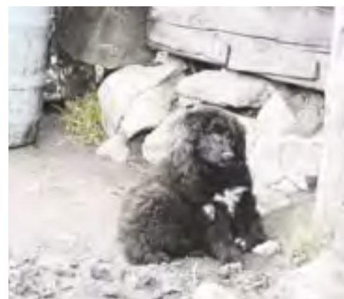
La stână, alt aer, altă blană.