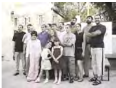
Artiștii din tabără