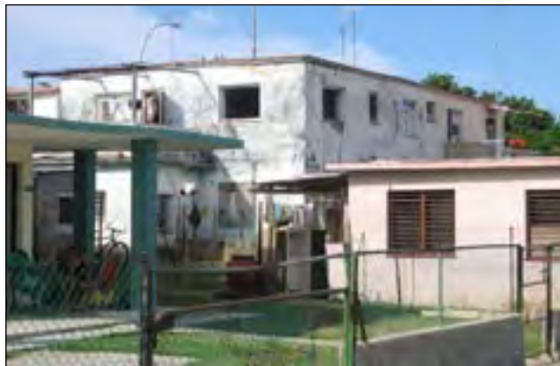
Cuba - cenușie pentru cubanezi