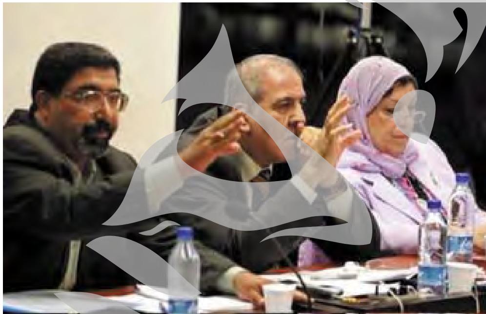
rațiile precedente ale negociatorilor sunniți, care au susținut că

putem accepta pentru că sunt de natură să creeze o divizare a țării”, au anunțat cei 15 negociatori sunniți, într-un comunicat difuzat ieri. “Am decis deci să nu acceptăm articolele care aduc prejudicii integrității teritoriale, unității populului și identității sale”, adaugă textul, înainte de a face apel la Liga Arabă, la ONU și la comunitatea internațională să susțină punctul lor de vedere. “Acest lucru nu ne va împiedica să participăm la procesul politic și să acționăm în favoarea unui Irak unit, începând cu următoarea etapă, alegerile”, precizează documentul, referindu-se la referendumul asupra Constituției, care va avea loc la 15 octombrie și la alegerile legislative care urmează să se desfășoare la 15 decembrie. Această atitudine contrastează cu declara-