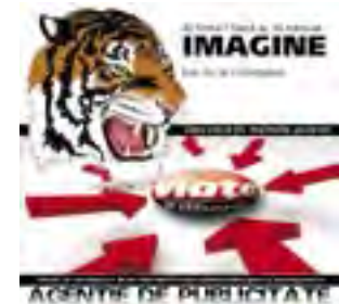
AGENCIILE DE PUBLICITATE