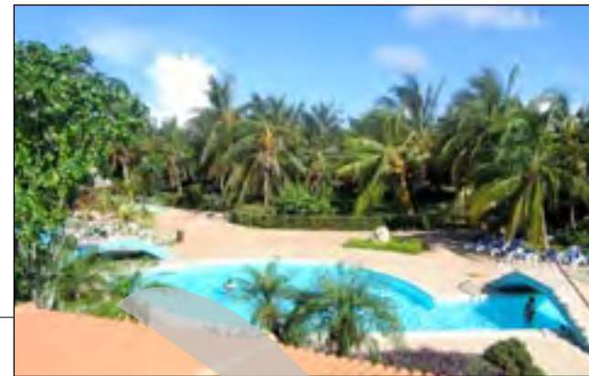
Cuba - lux pentru străini